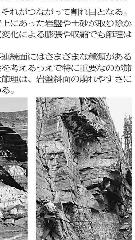
層理面(左)と節理(右)

※いわて防災学教室のバックナンバーは、岩手大学地域防災研究センターのホームページ「公開情報」で閲覧できます。