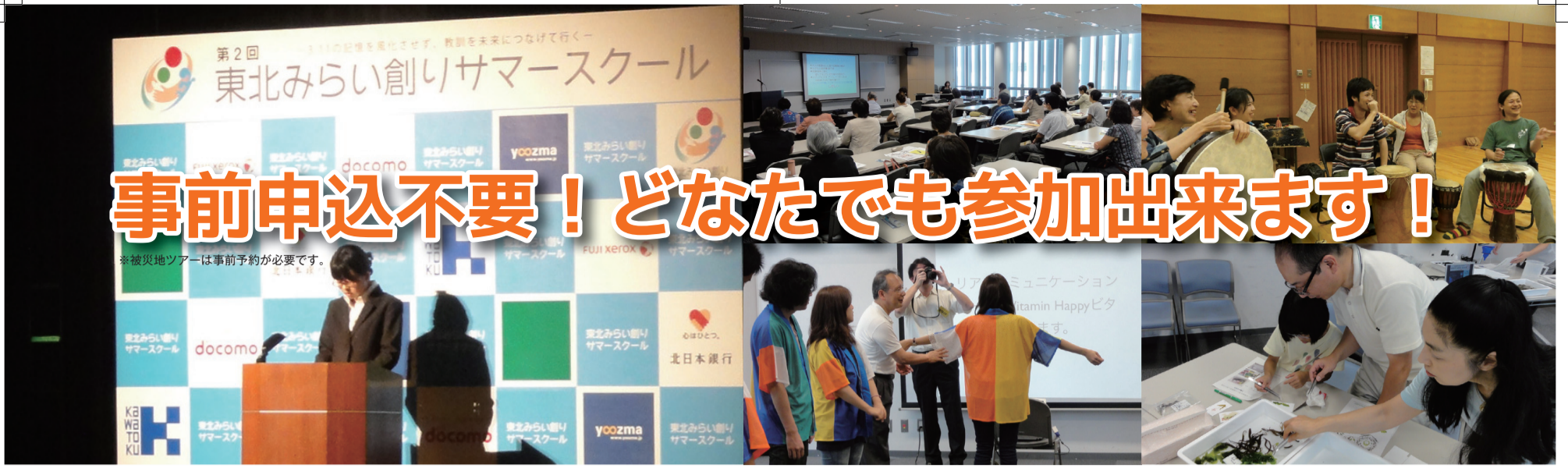
※写真は2013年のサマースクールの様子